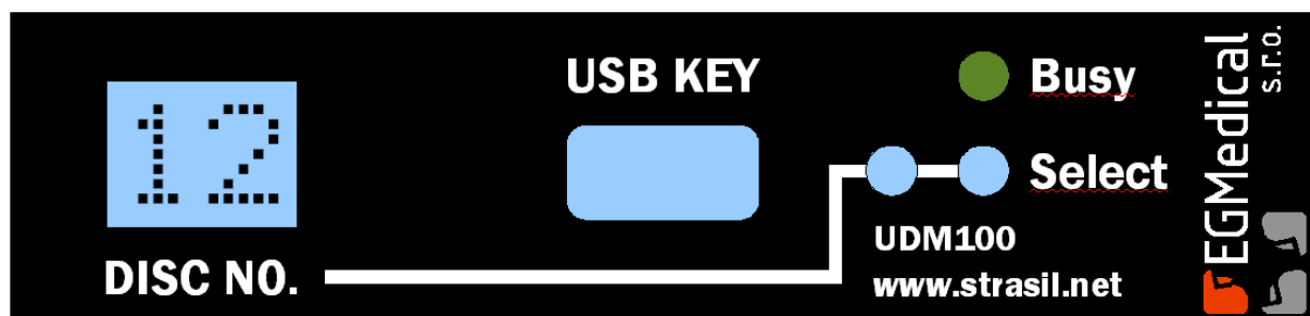
Obr. 1.1: Obrázek rozložení předního panelu zařízení